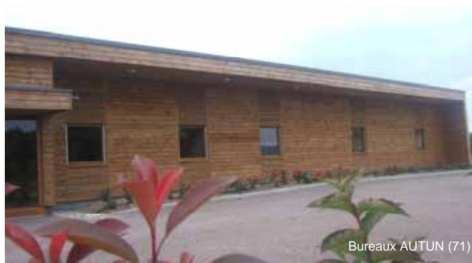
Bureaux AUTUN (71)

Les bureaux de Nevers et La Roche-Vineuse sont bien sur conservés ainsi qu'un bureau à Dijon. Les propriétaires forestiers sont cordialement invités avenue Saclier, Parc de Bellevue à AUTUN (71).