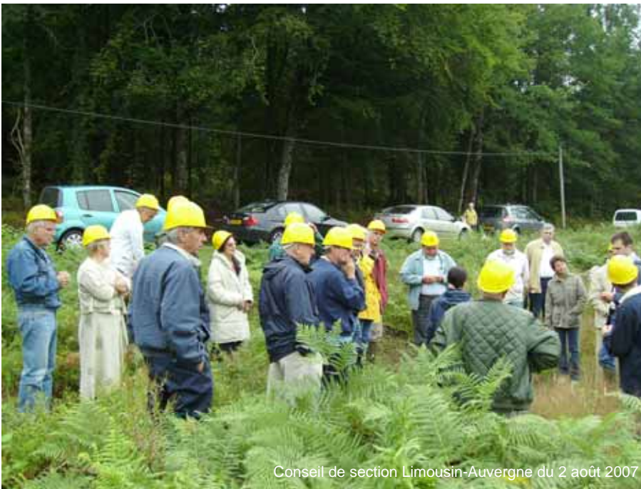
Conseil de section Limousin-Auvergne du 2 août 2007