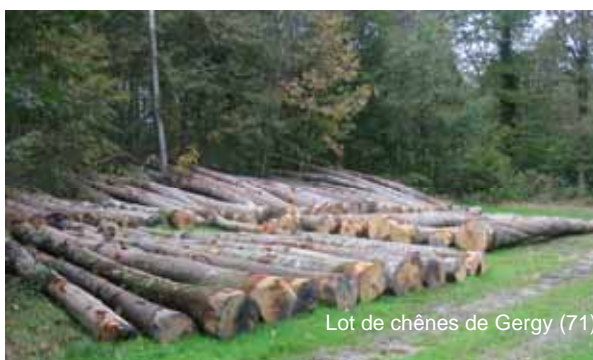
Lot de chênes de Gergy (71)

Chaque année votre coopérative organise des ventes groupées, vous offrant ainsi la possibilité de mettre vos bois sur le marché par un large appel à concurrence.