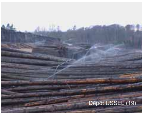
Dépôt USSEL (19)

L a réussite d'un stockage de bois par voie humide dépend de 3 règles principales :