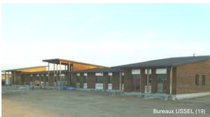
Bureaux USSEL (19)

A partir du 15 novembre, CFBL sera heureuse de vous accueillir, Parc de L'Empereur à USSEL (19). L'ancien siège social, ZA du Theil, est mis en vente.