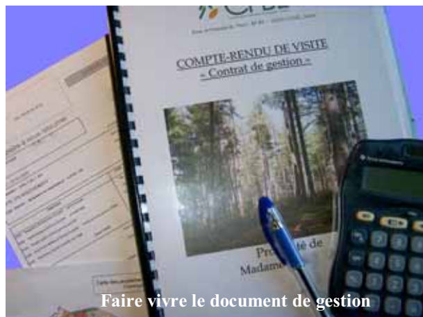
Faire vivre le document de gestion