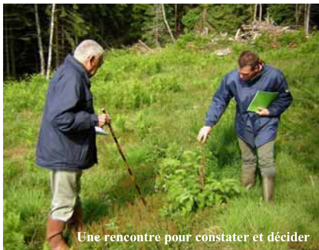
Une rencontre pour constater et décider